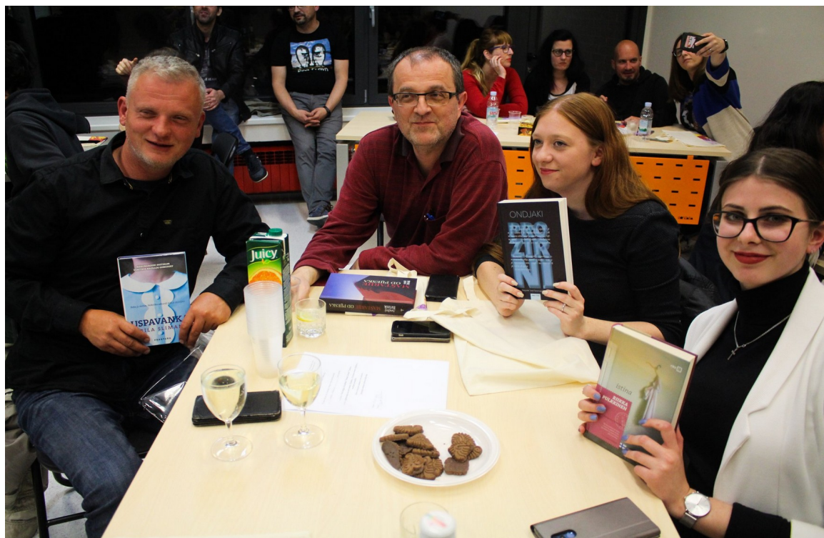
Slika 4. Kviz „Ne znam kak se zove knjiga“ - Noć knjige 2019. g.