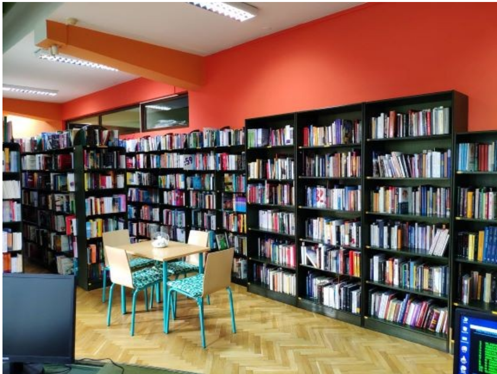
Slika 2. Odjel stručne knjige i publicistike

Knjižnica „Nikola Zrinski“ Čakovec je u 2019. godini ostvarila ukupne prihode u iznosu od 4.501.094,73 kn. Ukupni izdaci za izvještajno razdoblje iznose 4.619.790,85 kn. Manjak prihoda prebito iznosi -118.696,12 kn, ali imali smo preneseni višak prihoda iz 2018. godine koji je iznosio 181.739,00 kn, te se on umanjuje za manjak prihoda iz 2019.godine (-118.696,12), te je konačan rezultat poslovanja višak prihoda od 63.043,27 kn.