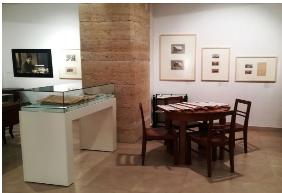
Slika 12. Izložba - Domorodci! Međimurci! Szženjstvu je našem kraj“

Završen je zajednički projekt (Muzej Međimurja, Državni arhiv Međimurja i Knjižnice "Nikola Zrinski" Čakovec) obilježavanja 100 godina od oslobođenja i vraćanja Međimurja Hrvatskoj koji je rezultirao vrlo posjećenom izložbom i knjigom o događajima 1918-1919. koji su bili povijesno značajni za Međimurje.