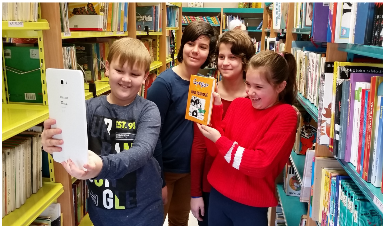
Slika 6. Upotreba aplikacije actionbound na radionici Guglanje za mudrice