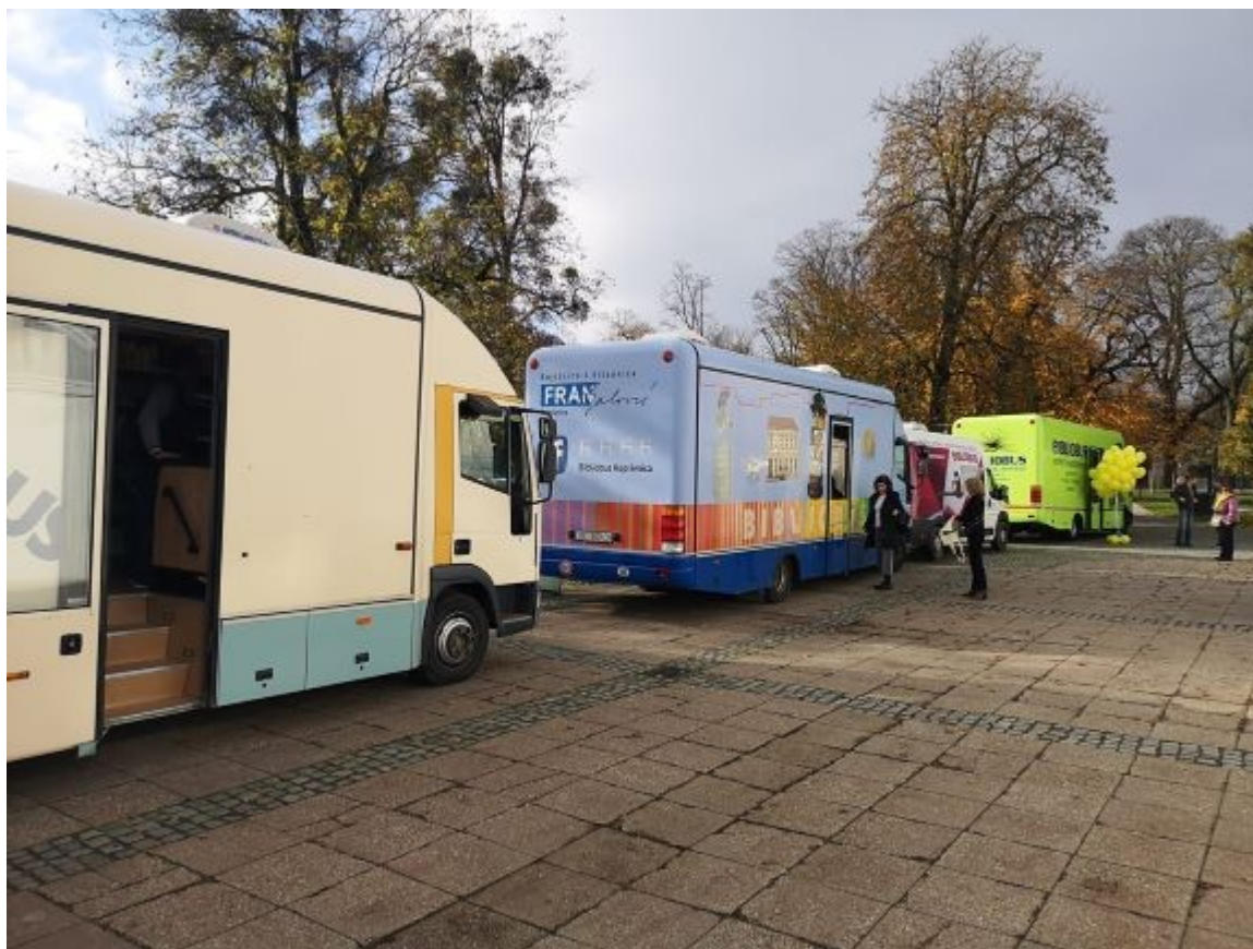
Slika 11. Mini festival bibliobusa, Čakovec 2019.