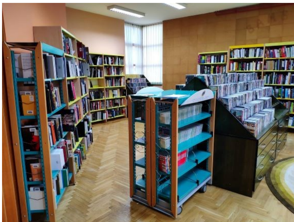
Slika 1. Multimedijalni odjel

Krajem 2019. godine Knjižnica „Nikola Zrinski“ Čakovec otvorila je i 2 nova odjela. Preseljenjem Dječjeg odjela i Igraonice „Bamblek“ u novi prostor, pripremali smo stari prostor i građu, kako bismo otvorili nove odjele u starom dijelu knjižnice. Nakon provedene revizije kompletne posudbene građe Informativno posudbenog - Općeg odjela, otvorili smo Odjel stručne knjige i publicistike i Multimedijalni odjel.