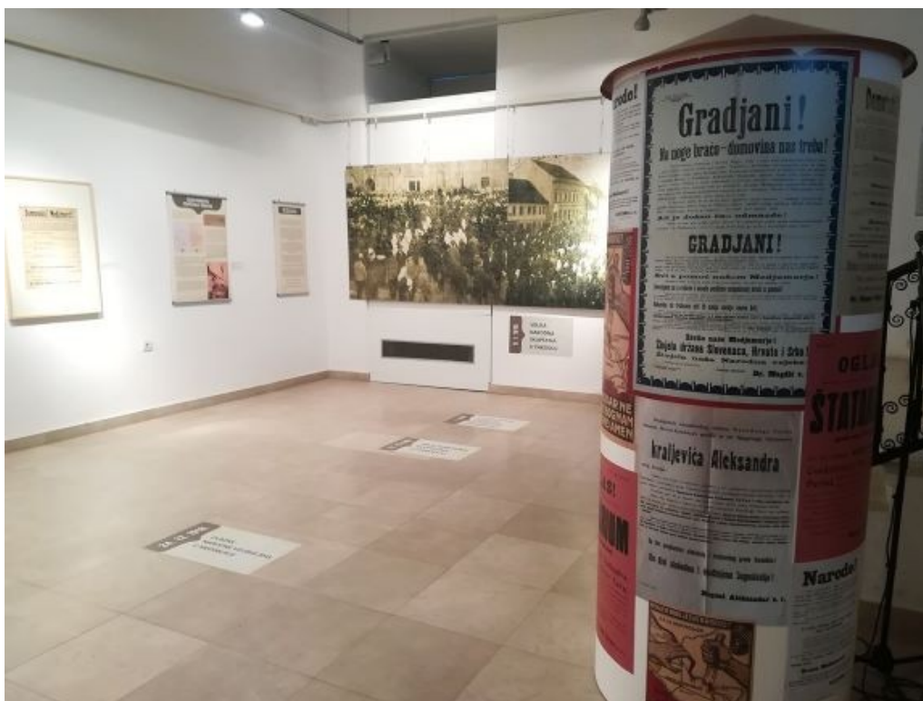
Slika 13. Izložba - Domorodci! Medjimurci! Szženjstvu je našem kraj“

Stručnjaci Muzeja Međimurja Čakovec, Državnoga arhiva za Međimurje i Knjižnice “Nikola Zrinski” Čakovec zajedničkim su istraživanjima dostupnih izvora i građe iz temom obuhvaćenoga razdoblja, postavili izložbu koja je zainteresirati javnost za prijelomne događaje iz međimurske povijesti kao i za rad naših ustanova na očuvanju materijalne i nematerijalne baštine Međimurja. Izložbu su posjetili muzealci, arhivisti i knjižničari iz raznih krajeva naše zemlje i susjednih zemalja.. Izložba je gostovala i u Hrvatskom državnom arhivu tijekom rujna 2019. godine.