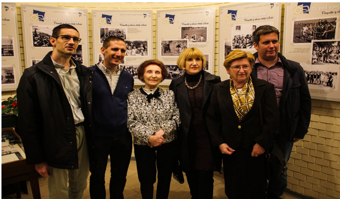
Slika 3. Otvorenje izložbe „Skrito pod vanjkušom” povodom Noći knjige 2019. godine

Na Općem odjelu prigodnim programom obilježene su manifestacije Noć knjige i Mjesec hrvatske knjige .