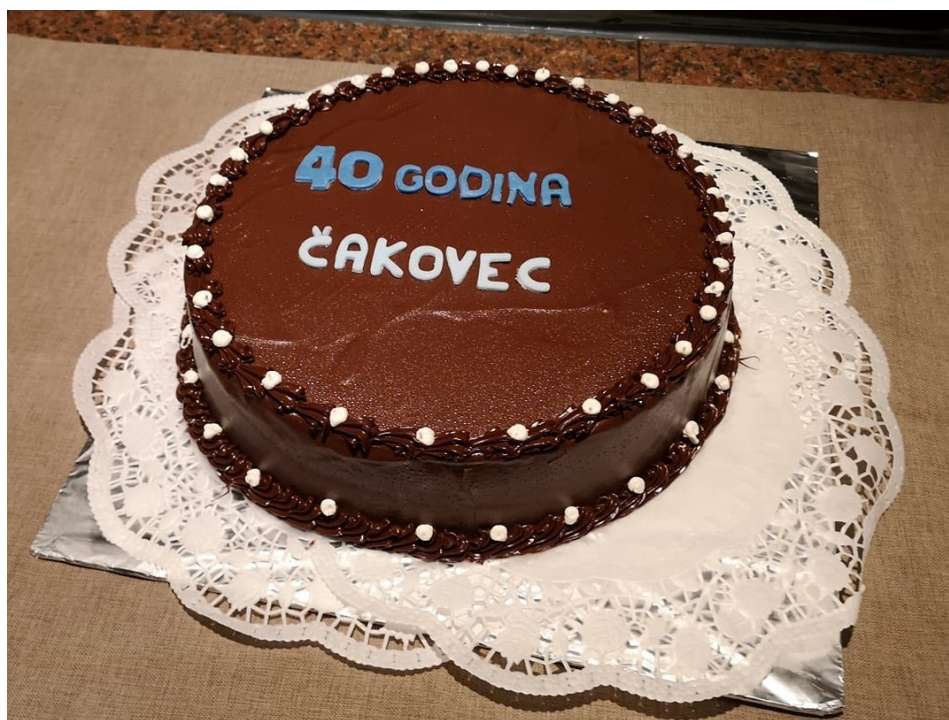
Slika 9. Poklon rječke gradske knjižnice - slavljenička torta povodom 40. godišnjice rada Bibliobusne službe Međimurske županije

Bibliobusna služba sudjelovala na 8. festivalu bibliobusa i 14. okruglom stolu o pokretnim knjižnicama u Republici Hrvatskoj , održanom u Rijeci od 7. do 8. lipnja 2019., na kojem je predstavljen rad Bibliobusne službe Međimurske županije u proteklih 40 godina . S ostalim ovogodišnjim slavljeničkim bibliobusnim službama uz slavljeničku tortu proslavljena je četrdeseta obljetnica rada naše službe .