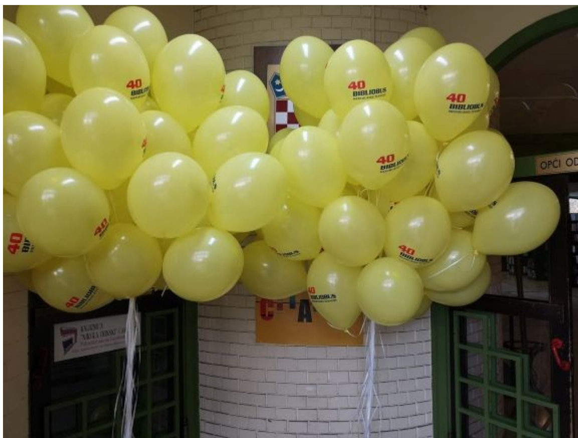
Slika 10. Izložba: „Četrdeset godina kulture u pokretu Bibliobusne službe Međimurske županije“

Prigodnom izložbom „ Četrdeset godina kulture u pokretu Bibliobusne službe Međimurske županije “: izložba fotografija i novinskih članaka iz arhive Knjižnice „Nikola Zrinski” Čakovec ” i Mini festivalom bibliobusa , na kojem su sudjelovale bibliobusne službe iz Bjelovara, Koprivnice i Križevaca . obilježena je 40 obljetnica rada Bibliobusne službe MŽ Obljetnica je proslavljena 11. 11.2019. U sklopu Mini festivala bibliobusa, održan je program upoznavanja s radom bibliobusnih službi, na kojem je sudjelovalo 11 vrtićkih grupa, od čega 253 djece i 22 odgajatelja.